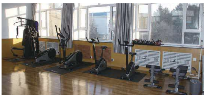
フィットネスジム