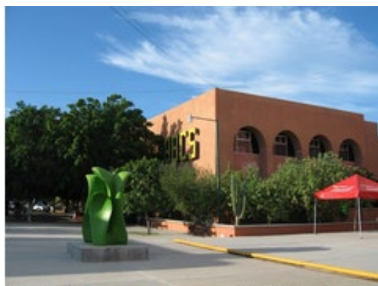
南バハカリフォルニア自治大学 (UABCS)

他者と関わりながら課題解決を実施する際の第一歩は、「チームワークの形成」であり、その後に課題解決につながるディスカッションや協働が行われます。本オンラインプログラムは、参加者同士のチームワーク力や連帯感を醸成し、将来の実留学をより効果的なものにするを目的として行います。プログラムはメキシコとオンラインで繋ぎ、メキシコ人学生(パートナー)との様々なアクティビティを通して「チームワーク」「協働力」を磨きます。