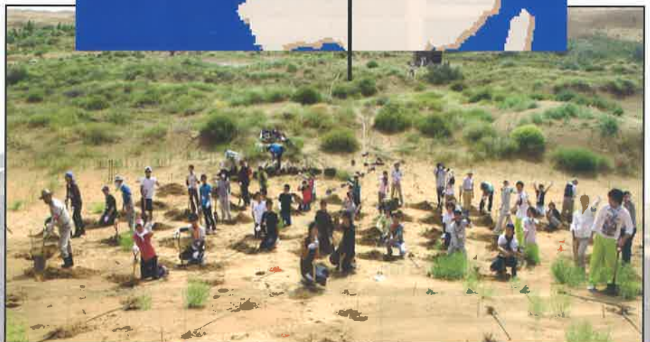
恩格貝にて植林風景