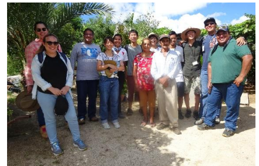
メキシコシティ研修