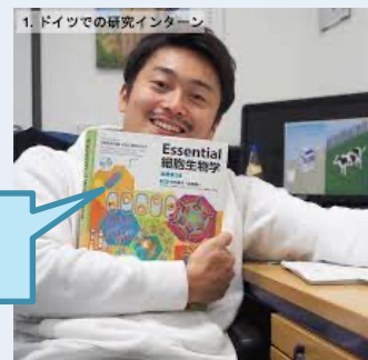
研究インターン (ドイツ)