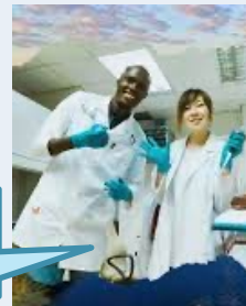
研究留学 (ボツワナ)