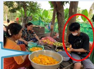
小学校インターン (カンボジア)