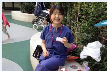
医学インターン (オーストラリア)