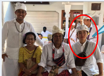
日本語学校サポーター (インドネシア)