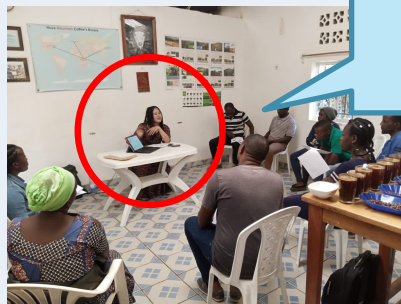
コーヒー農園 インターン (ルワンダ)