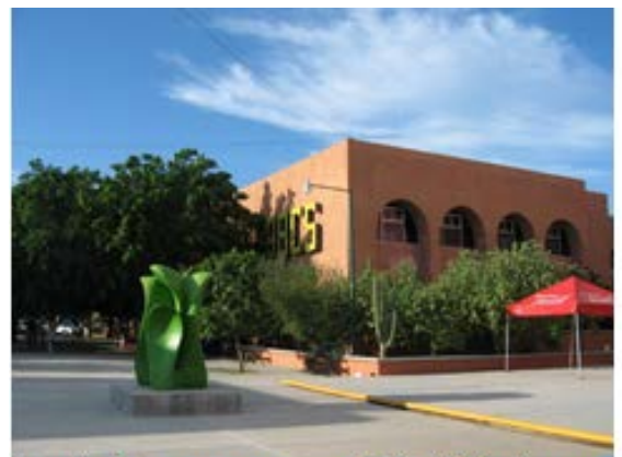
南バハカリフォルニア自治大学 (UABCS)

2020年9月1日(火)～9月30日(水) (約3週間) (9月1日～7日オンラインシステム登録、オリエンテーション)