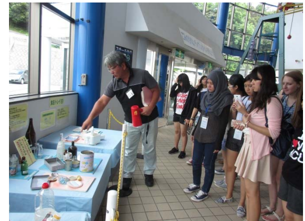
こうじょうけんがく リサイクル工場見学