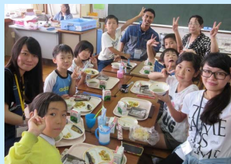
しょうがっこう こうりゅうかい 小学校で交流会