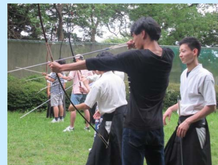
にほん たいけん 日本のスポーツ体験