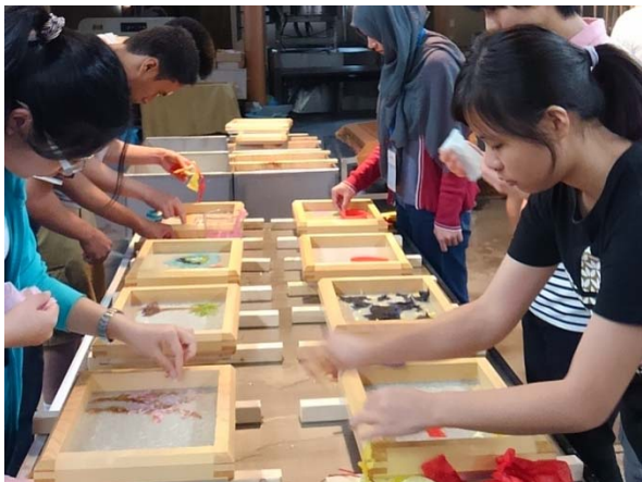
わしづく 和紙作り