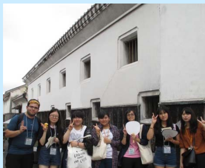
しないたんさく 市内探索

ホームステイ： はくみつか 2泊3日 ( しゅうめ 3週目の きんようび 金曜日 ~ にちようび 日曜日 )