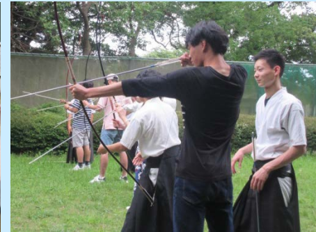
日本のスポーツ体験