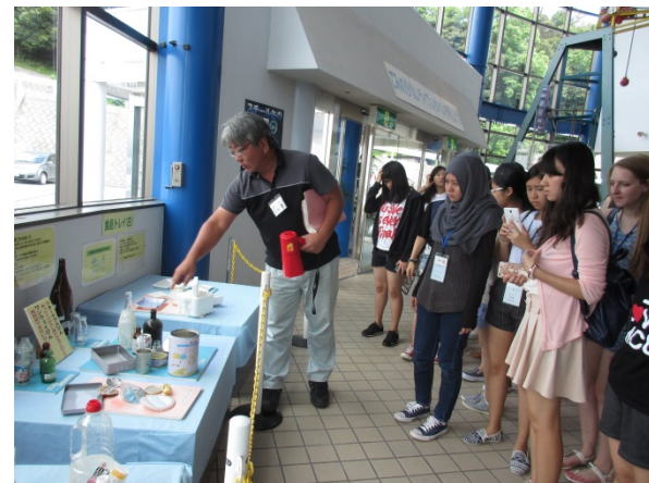
こうしょうけんがく リサイクル工場見学