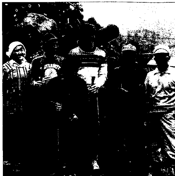
第5回からいも交流(1986年)

「日本人の友達ができない」、「日本らしい文化や背景を知ることができない」、「日本に家族がほしい」という留学生がたくさんいます。33年前、「本当の日本を理解したい!」という留学生の願いから、この交流が鹿児島県の農村で始まりました。今では、鹿児島と宮崎の約60の市や町に広がり、88の国/地域から約4508名の学生が参加して、南九州一般家庭の生活を体験しました。