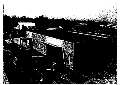
ヒロセインドネシア